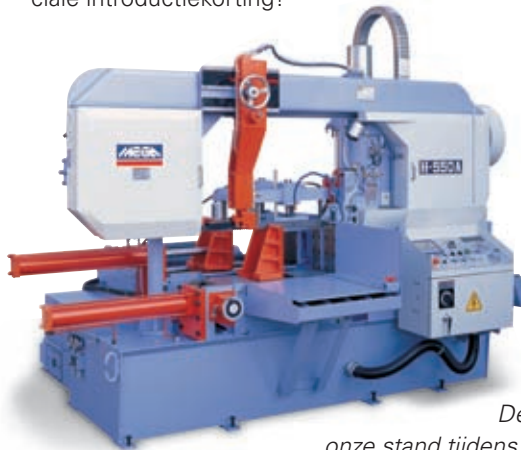
Deze machine is te bezichtigen op onze stand tijdens de METAVAK 2008-Gorinchem.

Informeert bij ons naar MEGA 2-kolomszaagautomaten en profiteert van onze speciale introductiekorting!